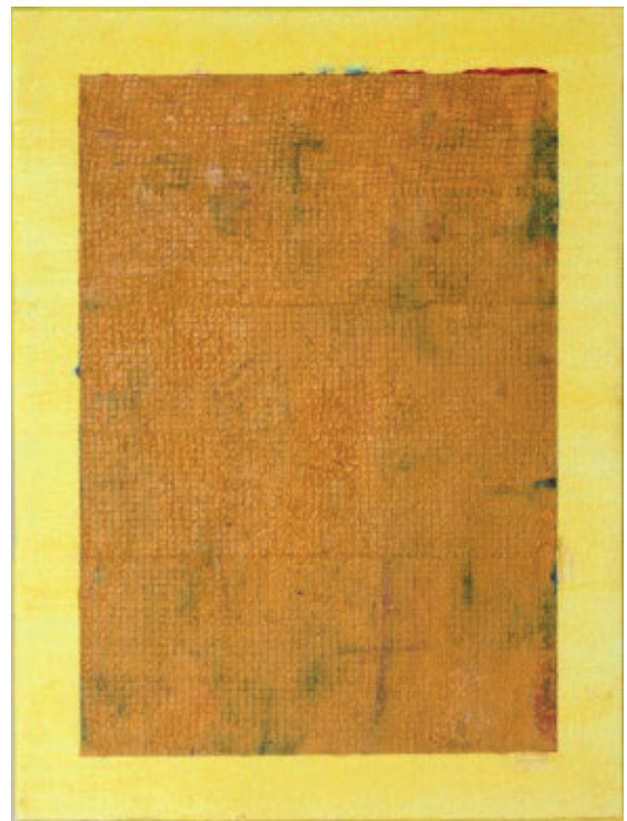
Atmósfera I (plano absoluto), 2017. Óleo sobre lienzo, 12" x 9".