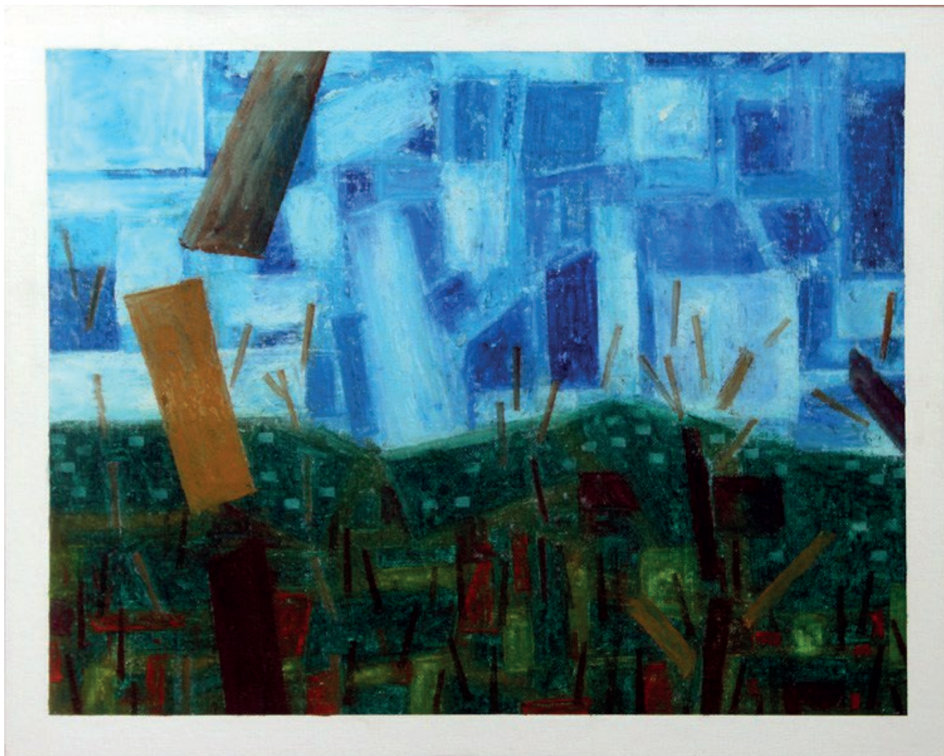
Irreconocible (paisaje hacia el este), 2017. Barra de óleo sobre lienzo, 16" x 20".

Profesor, Universidad de Puerto Rico, Recinto Universitario de Mayagüez