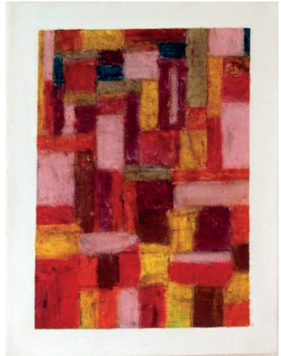
Acción inicial (zona de color), 2017. Barra de óleo sobre lienzo, 12" x 9".