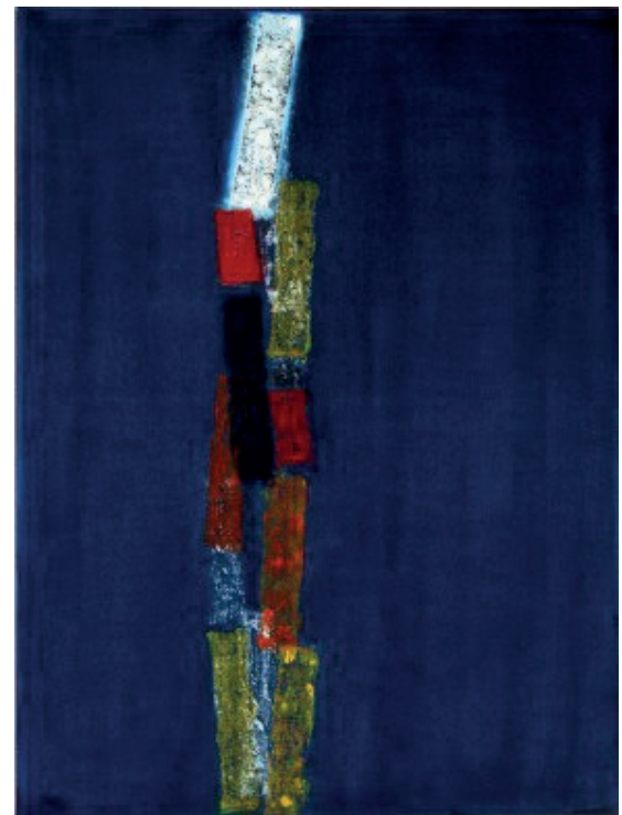
A oscuras (toque de queda), 2017. Barra de óleo sobre lienzo, 40" x 30".