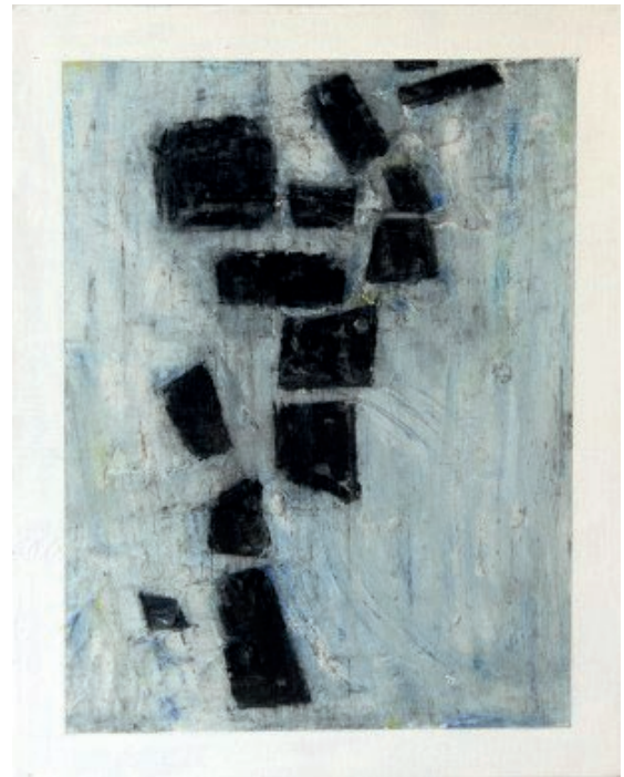
Incertidumbre (sensación indefinible), 2017. Barra de óleo sobre lienzo, 14" x 11".

Las pinturas Borrasca (rocío de chemtrail), A oscuras (toque de queda), Aurora (registro lumínico) y Whisky (apropiación) representan una liberación del concepto compositivo inicial de la muestra, con formas rectangulares irregulares a veces, desplazándose libremente en ocasiones por el espacio. La densidad del pigmento de las barras de óleo se manifiesta con fuerza y plenitud en estas formas, acaso el resultado de ya saberse resistente a experiencias traumatizantes. Una energía vital subyace en el brillo y la saturación de los colores de estas pinturas. La amplitud de espacio que permiten estos lienzos resulta en composiciones repletas de fuerza expresiva deliberada.