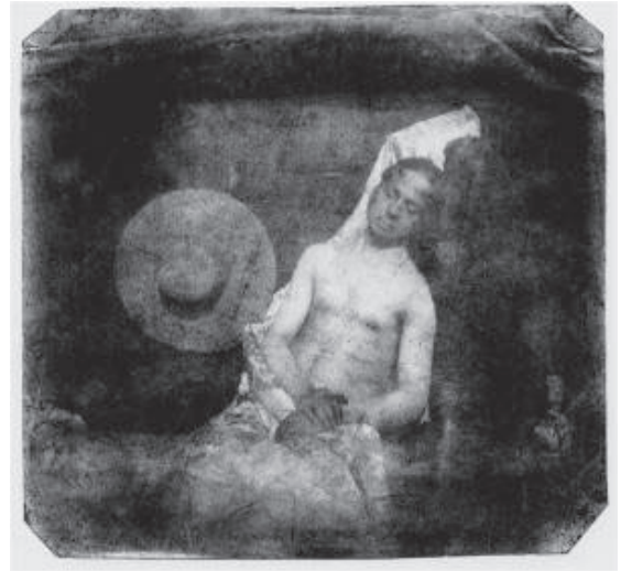
Hyppolite Bayard, Self-Portrait as a Drowned Man, 1840.

Adál me habló por primera vez del proyecto del libro, para el que escribí el prólogo, el semestre pasado, cuando Río Piedras estaba en plena huelga. Me parece sumamente irónico que éste vea la luz ahora, en este Puerto naufrago y nada Rico. En su serie fotográfica, Adál busca explorar la condición colonial de Puerto Rico y las reacciones individuales a esta situación política. El detonante para la serie fue, por supuesto, la crisis fiscal de proporciones épicas de nuestra Isla. Pero la sensación de encierro, de impotencia y de claustrofobia