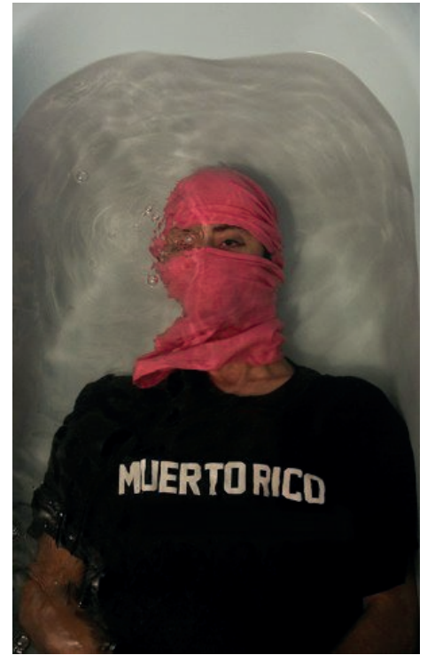
Puerto Ricans Underwater: Bold Destrou.

que muchas de esas fotos revelaban parece de un acierto aún mayor tras nuestra experiencia reciente. Sobrevivir a este huracán se siente como estar diez minutos debajo del agua... Si acaso la angustia isleña es ahora aún mayor.