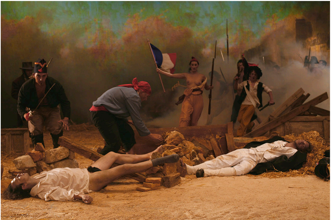
Cristina Lucas, La Liberté Raisonnée , 2009.

Universidad de Puerto Rico, Recinto de Río Piedras