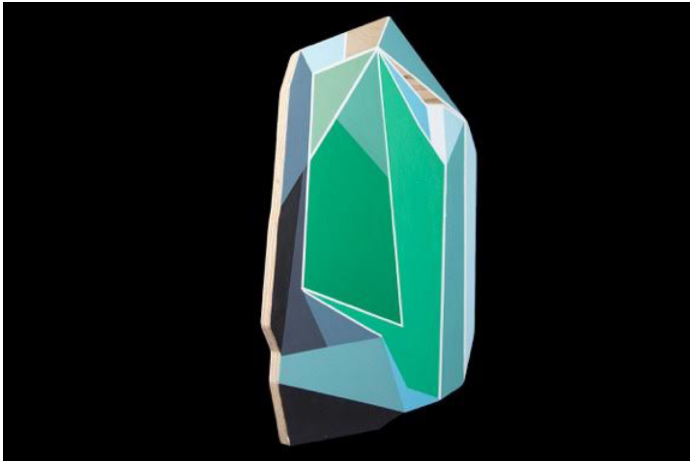
Cybelle Cartagena, En alta frecuencia , 2016.

tonos y tintes planos sobre el panel de roble ya cortado a semejanza del contorno del cuarzo, logrando así una composición única de cada cuarzo, que vacila entre la realidad y la abstracción del propio objeto.