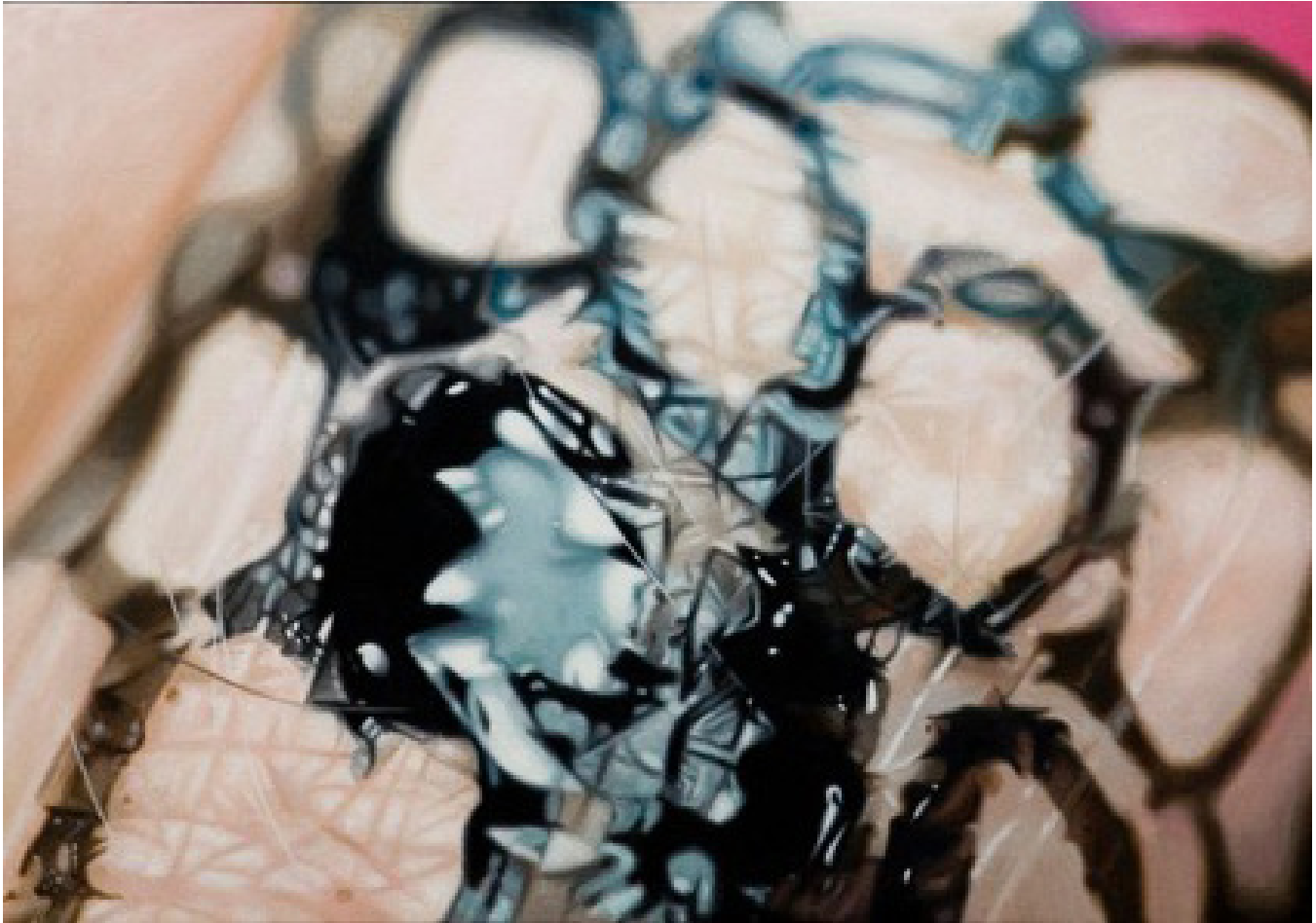
Cybelle Cartagena, Tinta en mi piel , 2016.

Artista y Gestora Cultural Independiente