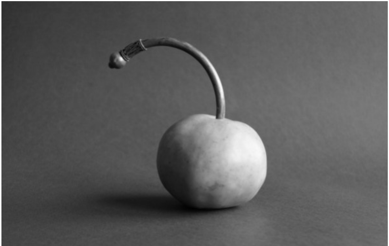
Rafael Trelles, El pez en llama , 2016.