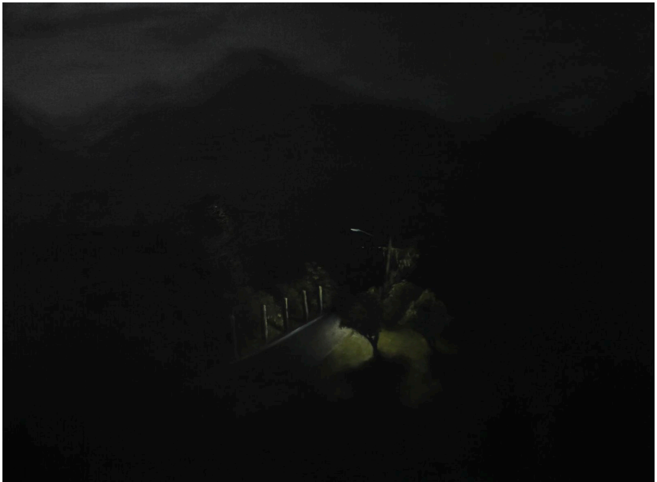
Jotham Malavé, Exhibición: Paisaje al acecho , 2015.

Friedrich Nietzsche, Más allá del bien y el mal (1886)