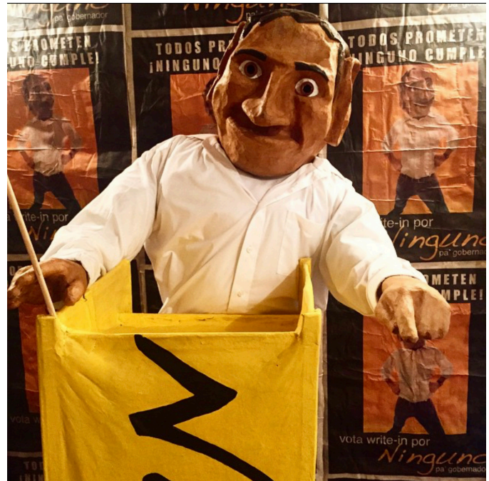
Papel Machete, Ninguno , 2015.