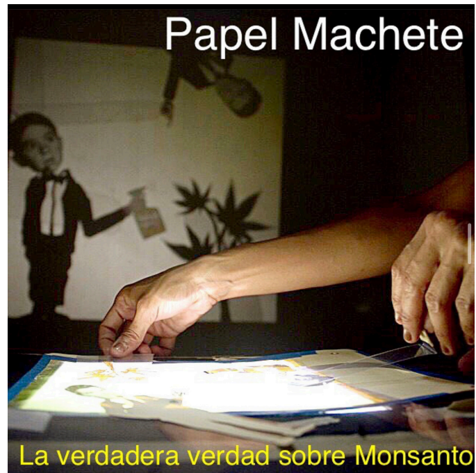
Papel Machete, La verdadera verdad sobre Monsanto , 2015.

La exhibición Con Papel y con Machete estará disponible para visitas hasta el 27 de junio en la Casa Taller, situada en la Calle Martín Travieso #1550. Para citas, comuníquense escribiendo a: agitarte@gmail.com