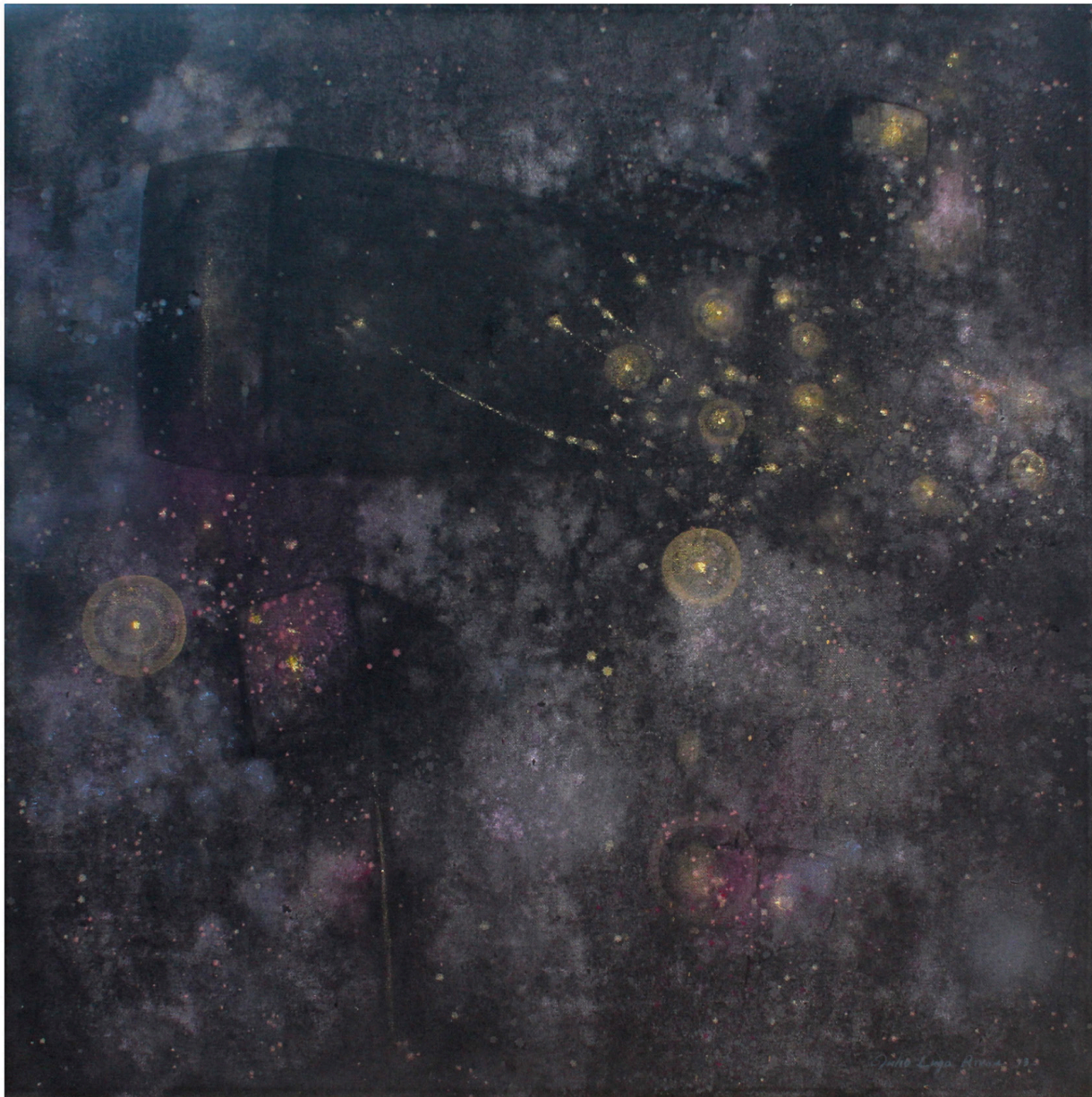
Julio Lugo Rivas, El origen de las estrellas , 2013.

Lugo Rivas mezcla acrílicos y los ensucia un poco. Sus colores parecen venenosos y esta disonancia a la vez perturba e intensifica nuestra percepción de estas pinturas. La mente del observador se pone en tensión. El artista nos presenta un curioso espacio alterno que cautiva e irrita la vista, un maravilloso campo abierto para descubrimiento mutuo, un asfixiante ambiente contaminado por un ruido ensordecedor, emisiones, cenizas negras y toxinas. Su intención es que el espectador experimente la fusión y la confusión de estas variadas ecologías con todos sus sentidos: palpando, oliendo y saboreando la atmósfera, imaginando la velocidad, la energía, el movimiento, el sonido y la vibración de la escena.