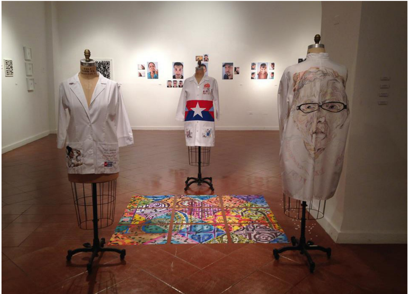
Exhibición: Rompecabezas , Pontificia Universidad Católica de Puerto Rico, 2015.

Universidad de Puerto Rico, Recinto de Ponce