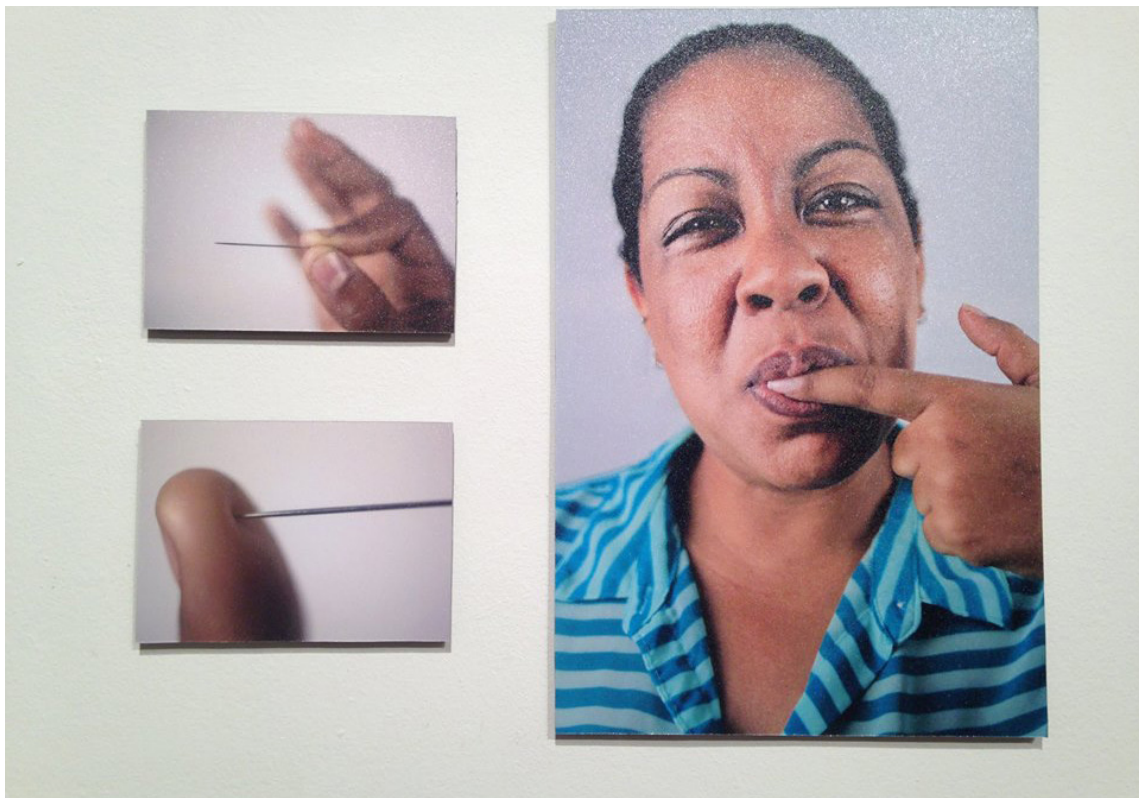
Angélica Allen, Duele (Serie Sentidos) , 2015.

Tal fue la resonancia de la obra Sentidos , de la artista Angélica Allen, compuesta de cinco alusiones sensoriales organizadas en secuencias de fotos: “Ruido”, “Tu piel”, “No quiero darme cuenta”, “Me gusta” y “Duele”. En este sugerente conjunto de imágenes complementarias, la artista reivindica el carácter imprescindible de los sentidos, invisibilizados en la dimensión de lo cotidiano. “A veces no nos percatamos de lo importante que es cada uno. De ahí que, en mi propuesta, los individuos quedamos plasmados a través del sensor digital de mi cámara para, de esta manera, convertirnos en una prueba artística en la que nuestras reacciones quedan retratadas a través de los sentidos”, explica Allen en torno a su obra, a la que incorporó su autorretrato y que destacó el empleo de la luz de tungsteno.