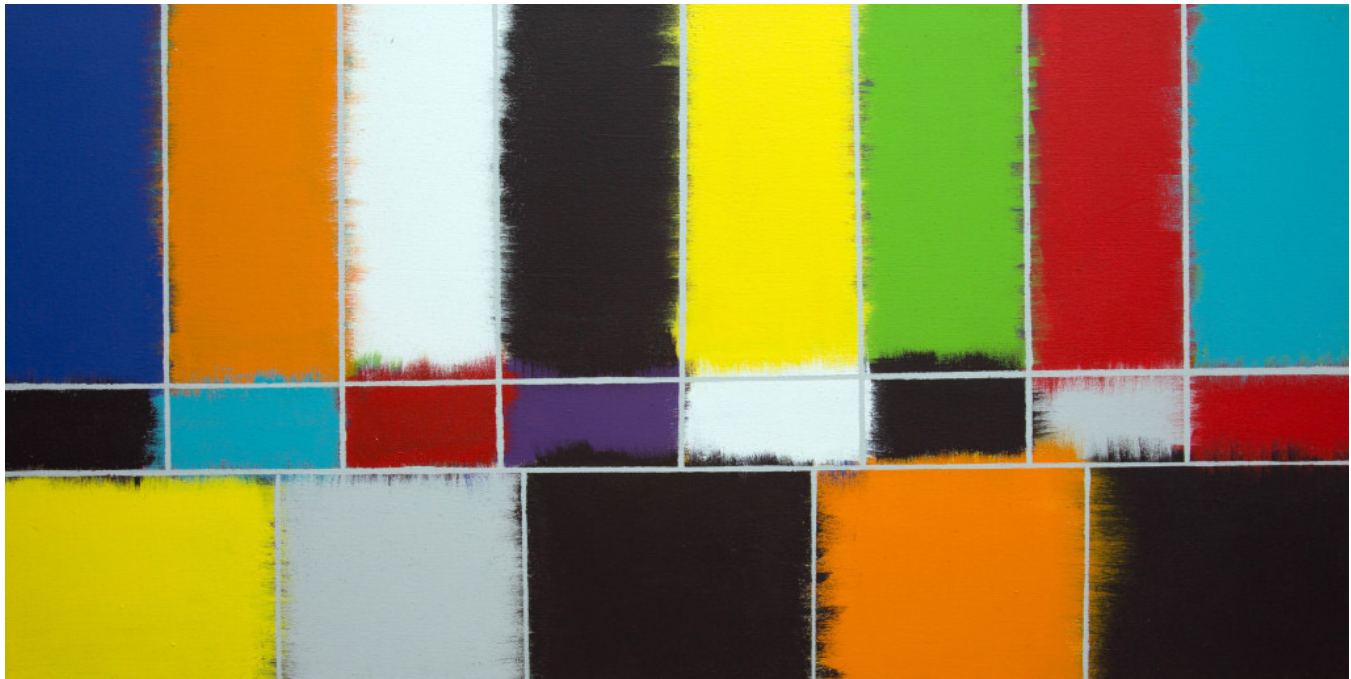
Quintín Rivera Toro, Sin señal , Látex sobre lienzo, 2015.

Me gustaría invitar a analizar la exhibición ya que va más allá de la celebración del acto de pintar y de producir lienzos más o menos correctos, más o menos bellos, más o menos comprensibles y que puedan ser mercadeados. A mi entender, el propósito que subyace en esta muestra es establecer una relación metafórica entre las señales de ajuste y la vida misma, entre los mecanismos psíquicos o las vivencias personales que condicionan la producción artística y la pérdida de señal, que puede ser entendida como esos momentos de poca inspiración o de desconexión con las ideas. Así, el acto de pintar se convierte en un mecanismo de desahogo, de desbloqueo –como explica el propio Rivera– y que a su vez genera una serie de objetos que se dan a la percepción y la interpretación, pues crear desde el ámbito de la estética supone una actividad performativa , que es a la misma vez un acto abstracto y concreto. Es ese acto abstracto el que atrapa mi atención en la obra de Rivera y me resulta ciertamente sugerente: que la obra emerge como concreción efectiva de un “bloqueo conceptual”. Y bien, de este proceso surgieron una serie de pinturas que ocupan casi en su totalidad las paredes del espacio central de la galería, una fotografía y el rastro de un performance llevado a cabo el día de la apertura.