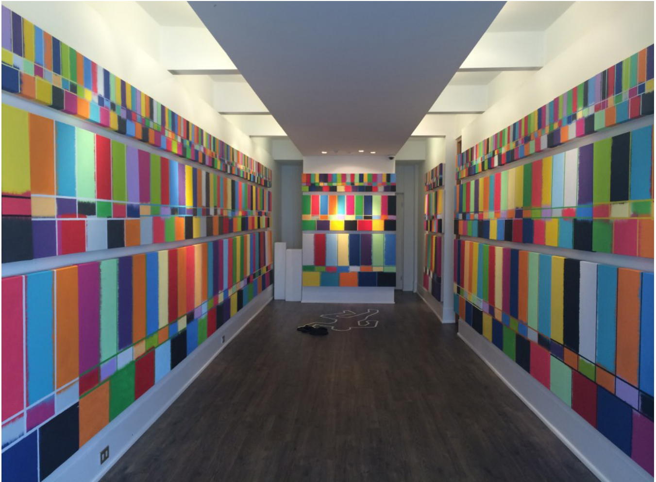
Quintín Rivera Toro, Sin señal , 2015.

partir del acto artístico. En una pequeña sala contigua pueden apreciarse otras pinturas y una fotografía realizada en 2012, que funciona a modo de boceto para la acción que se llevó a cabo en la apertura. Al visitar su propio trabajo, en el reordenamiento de sus ideas, Rivera busca reactivar la señal, hacer frente al bloqueo conceptual y registrar las dificultades inherentes a la producción plástica en la contemporaneidad.