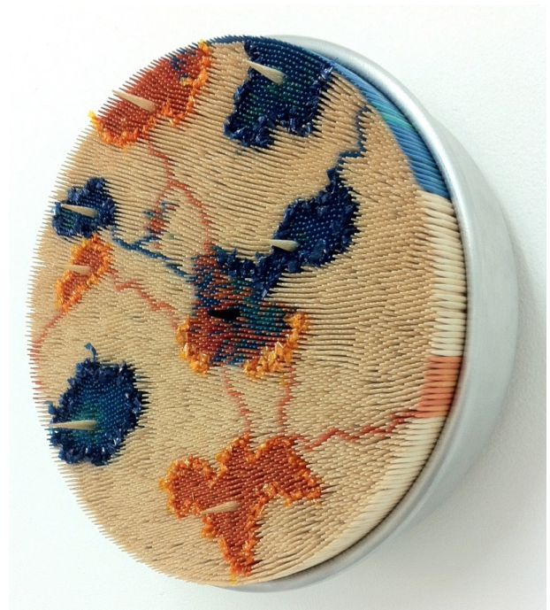
Rafael Acosta, Exhibición: Absoluto Híbrido , 2015.

La presente exhibición proviene fundamentalmente de la experimentación con el objeto encontrado, pasando por un proceso de entendimiento de la materia en pro de la ejecutoria y de la imagen, para concluir en un sofisticado resultado que provoca al tacto, que activa y que manipula la visión. Esto implica que el artista nos ofrece el resultado de un proceso meticuloso de investigación, conversación y negociación con todos los elementos antes planteados. A su vez, la precisión gráfica y las consideraciones compositivas juegan un papel importante en el resultado final de la obra. Aquí lo material y lo que no lo es, se convierten en un solo ente contenido en un mismo espacio. El vacío se llena de la posibilidad de ser ocupado y la materia luce ágil y dinámica, lo que invita a la cercanía del espectador, provocando que el movimiento de su mirada hacia cualquier dirección revele lo que es una obra lúdica y permanentemente cambiante. Retomando las palabras del artista venezolano Jesús Soto, podemos concluir que “lo material es la realidad sensible del universo. El arte es el conocimiento sensible de lo inmaterial. Tomar conciencia de lo inmaterial en su estado de estructura pura es franquear la última etapa hacia lo absoluto”.