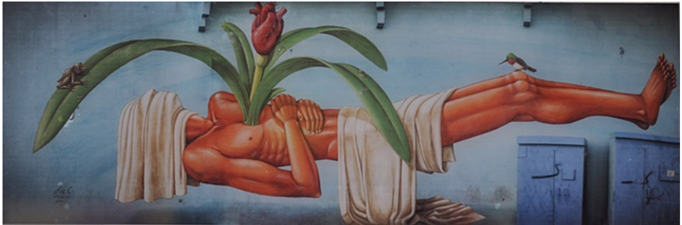
Interesni Kazki (Ukrania), Los muros hablan , 2014.

el tiempo, se les pasó el tren”. Sólo echemos un vistazo a la historia. El mismo Mark Rothko, considerado un artista autodidacta, tenía treinta años cuando realizó su primera exposición individual, en el espacio Contemporary Arts Gallery. Jean Dubuffet, por su parte, se consagró a la pintura después de haber cumplido los cuarenta años, y es en 1944 cuando realiza, en la Galería René Drouin, en París, su primera exposición individual, a los 43 años. Por su parte, Henri Rousseau se retira de su empleo en una oficina municipal de recaudación de arbitrios de París, con 41 años, para dedicarse a la pintura. Estos son sólo algunos ejemplos de los tantos artistas que fueron emergentes después de alcanzar la treintena.