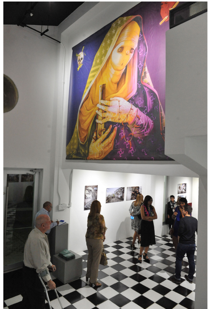
Exposición fotográfica Los muros hablan en Espacio Emergente, Bayamón, P.R., 2014.

Como en muchas otras carreras, se le requiere al solicitante experiencia, una actividad que en muy pocas ocasiones el artista ha tenido la oportunidad de construir, puesto que la propia estructura local le limita ese espacio al artista emergente. Y como artista emergente no me refiero al artista necesariamente joven, aunque la principal población es de artistas recién graduados. En este sector considerado como artistas emergentes, se debe aglutinar a todos los artistas que en un momento de su vida decidieron o deciden entrar de lleno a producir en las artes visuales, para comunicar, plasmar sus inquietudes, construir un discurso, desarrollar una carrera o, como bien señalaba Rothko, que como él decidieron que esa era la vida para ellos. No se deben aceptar los comentarios de personas que suelen ser influyentes en la cátedra, los museos y en el mercado del arte cuando expresan: “no son personas jóvenes, ya se les pasó