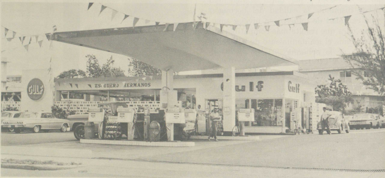
(4) Estación de Servicio Gulf Arq. Llenza y Gautier

mediante el uso de una losa cáscara y le sugiere al Arquitecto un paraboloide hiperbólico como forma para la estructura. De esta manera se utiliza una estructura que aparte de su robustez resulta ser graciosa.