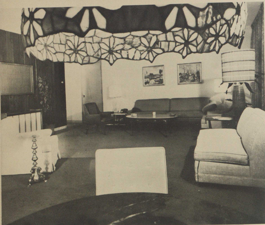
Apartamiento de Commonwealth Oil Refinery en el Hotel La Concha.