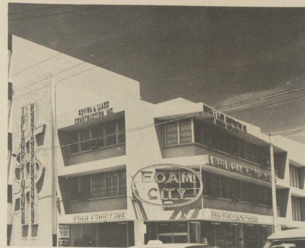
. . . afeado lastimeramente por la anarquía y desorden con que se le ha cubierto de letreros y anuncios.

Nuestra crítica constructiva de hoy, muestra cómo la falta de coordinación colectiva de los ocupantes de un edificio planeado de manera eficiente y con buena expresión arquitectónica, ha sido afeado lastimeramente por la anarquía y desorden con que se le ha cubierto de letreros y anuncios, de todos los tamaños, formas y colores, factor que lastima estéticamente a una importante esquina de nuestra capital. Aparentemente, el único concepto que se ha tenido en cuenta al recubrir este edificio de afiches, ha