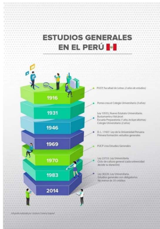
Figura 2: Infografía sobre los Estudios Generales en el Perú 3

Con la trayectoria y prestigio obtenidas, se estima el reconocimiento studium generale , al que se proponen los jóvenes de variados sectores para lograr una formación básica de contenidos, dándose una licentia docendi con aplicación extendida para enseñar.