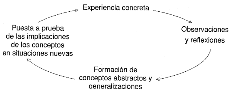
FIGURA 1 El círculo de aprendizaje según David Kolb

decir, analizarlas desde diferentes perspectivas. Luego puede crear o aplicar conceptos abstractos y tratar de integrar sus observaciones, de manera implícita o explícita, en un marco teórico coherente. Estos modelos mentales se aplican en las prácticas diarias concretas, donde se toman decisiones y se solucionan problemas. La experiencia de una intervención en la práctica puede ser a su vez el tema de una nueva reflexión, iniciando de esta manera otro círculo de aprendizaje. Según Kolb, los individuos, grupos sociales y culturas difieren en su estilo de aprendizaje, es decir, en el peso relativo que le dan a cada una de las actividades de aprendizaje; sin embargo, ninguna puede descuidarse.