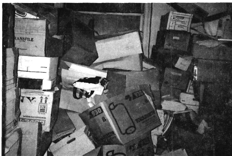
Estado en que se encontraba la documentación antes de la organización del archivo