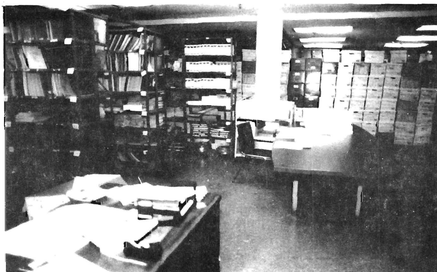
Vista actual del depósito de documentos, y de los anaqueles de la biblioteca.