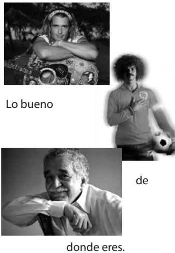
Figura 2: Brandcepts: emoción de orgullo vinculada a Origen

Entre los atributos que Beverland (2005, 2006) propone para el concepto autenticidad, se seleccionaron los de herencia y linaje y relación con el lugar , como sinónimos propios de la categoría Origen . Sobre el particular, Lewis y Bridger (2000) también sugieren asociar la relación con un lugar en los esfuerzos por conferir halo de autenticidad a un producto. Asimismo, Peterson (2005) se refiere a la identidad étnica y cultural. De estos atributos se puede derivar una emoción natural de orgullo, evidenciada en la Figura 2.