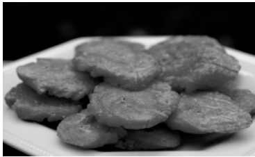
Figura 6: Brandcepts de productos evocados

Las participantes también fueron expuestas a varios brandcepts asociados a productos. Dichos bocetos sirvieron como preámbulo al diálogo acerca del producto suero costeño y el concepto de la autenticidad. Los siguientes brandcepts fueron los más comentados: