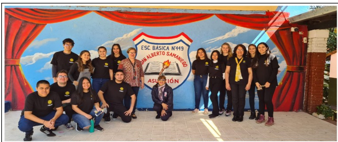
Foto grupal de futuros docentes de la FACEN y las docentes implementadoras del Proyecto KOSKO en la Escuela Nro. 449 Juan Alberto Samaniego, 12-10-2022.

Proyecto KOSKO en la Escuela Nro. 449 Juan Alberto Samaniego (Paraguay)