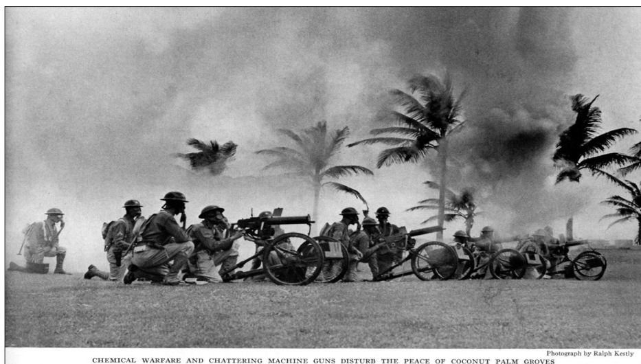
Fig. 2 - Maniobras del 65 de infantería (NGS – diciembre, 1939, p. 726)

guerra en la bahía, y ejercicios militares del regimiento 65 de infantería, indicando que Puerto Rico demuestra estar preparado “ para asumir su nueva importancia como perro guardián del canal de Panamá ”. 20