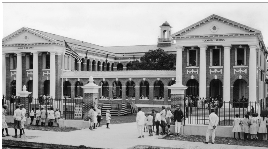
Fig. 1 – “A type of schoolhouse which the United States has given to Porto Rico” (NGS - diciembre, 1924, p. 626)

el autor no puede evitar reconocer que la presencia de la civilización europea en la isla precede por siglos a la de los propios Estados Unidos, 16 rápidamente concluye que “es el progreso de Porto Rico... desde la llegada de los Estados Unidos, escasamente un cuarto de siglo atrás, lo que representa el más inspirador capítulo en la historia de la isla... mostrando lo que el Tío Sam ha logrado hacer con su protegido” (p. 605).