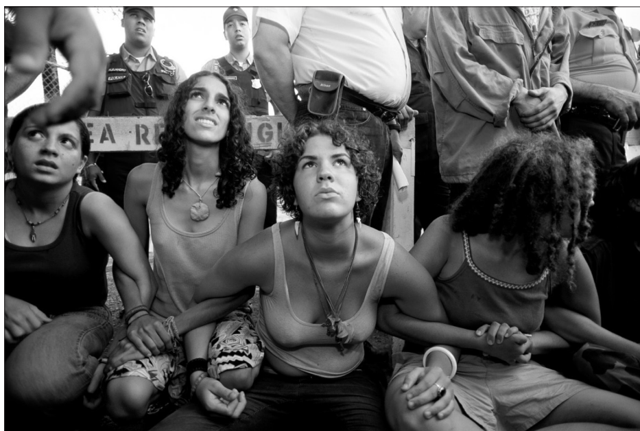
Fig. 7 – “Peaceful protesters”. Protestas en Vieques (NGS – marzo, 2003, p. 46)

Como es práctica institucionalizada en las publicaciones de National Geographic , las imágenes fotográficas constituyen otro texto visual que complementa, apoya e incluso expande el texto escrito del artículo. En total el artículo cuenta con catorce (14) fotografías tomadas por Amy Toensing, fotógrafa que había sido comisionada a cubrir la Isla en varias ocasiones durante la década anterior. Algunas de estas imágenes, estratégicamente utilizadas, y siempre connotadas por el texto descriptivo que las acompañan, sirven para reforzar el mensaje sobre la resistencia cultural puertorriqueña. Una fotografía a doble página de una joven vestida con la bandera de Puerto Rico sirve para abrir el artículo, y para señalar que “ el orgullo en su estrella solitaria tiene a los puertorriqueños ondeando, y vistiendo, su bandera en todo lugar ” (pp. 34-35). En un estudio de contrastes, en la página 41 se inserta, en un pequeño y apretado recuadro, la figura de cuatro (4) damas de alto nivel social, las cuales describe como “ parrot-bright socialités ” ( damas de sociedad con colores