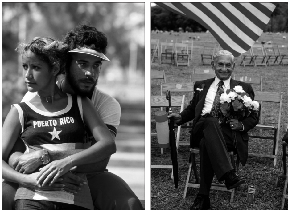
Fig. 6 – “ Holding tight to their pride as Puerto Ricans ” (izquierda, p. 517) / “ Patriotism runs strong ” (derecha, p. 543, NGS – abril, 1983)

“halados en ambas direcciones por poderosas fuerzas económicas y sociales, los puertorriqueños luchan con este dilema, mientras debaten sus opciones entre la estadidad, el estado libre asociado o la independencia”.