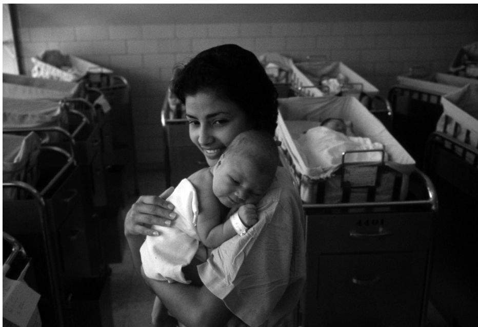
Fig. 5 – “Day-old islander” (NGS – diciembre, 1962, p. 791)

la política de los EUA, y gozando de “ un renacimiento cultural –pintura, música, literatura ”. Cestero, por su parte, también planteó una solución final al dilema de estatus, pero como una nación independiente, con “ relaciones amistosas ” con los EUA. Tanto para Felisa Rincón como para Muñoz, lo prioritario en el futuro de los puertorriqueños no giraba necesariamente en torno a las formas políticas, sino más bien al progreso económico y social: “ ¡Ah, qué hermoso futuro! Cuando nuestros niños sean grandes, toda nuestra gente será clase media. Todos estarán libres de envidia ” (Felisa Rincón); “ El niño de hoy, cuando crezca, tendrá un hogar propio, uno agradable. Cada objeto dentro de su hogar será para la comodidad y disfrute de la familia. El niño de 1962 tendrá una educación universitaria...la familia vivirá en un estado libre asociado, pero uno grandemente expandido...cuando lea los libros de historia todo este debate sobre estadidad o independencia le parecerá extraño, muy extraño ” (Muñoz Marín).