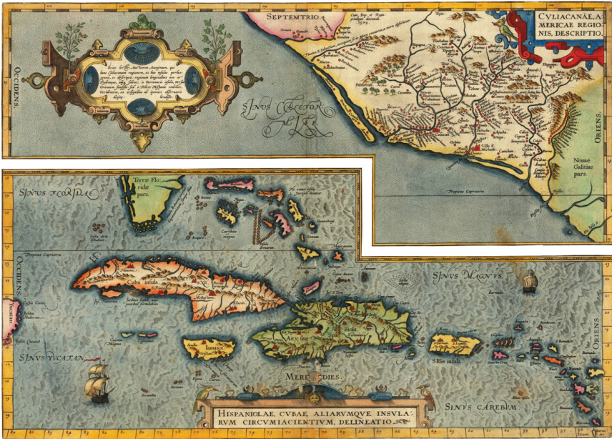
Mapa 1. Abraham Ortelio, “ Hispaniolae, Cubae, Aliarumque Insularum Circumiacentium, Delineatio ”, accesado en < https://www.bergbook.com/images/12456-01.jpg >. Imagen cortesía de Antiquariat Reinhold Berg e.K., < www.bergbook.com >.

Golfo-Caribe temprano en el siglo XVI, cuando las Antillas, Florida y Yucatán fueron consideradas como “escudo ante-mural” y frontera atlántica del Virreinato de la Nueva España. Antonio Gaztambide-Géigel (2006:32-34) señala que “mediado el siglo XVI” al menos un mapa francés describe un Mer des entilles . 17 Asimismo, en 1588 Abraham Ortelio nombra el Sinus Carebum en uno de los mapas de su Theatro de la Tierra Universal : lo ubica al sur de la isla de San Juan en la zona que bordea el arco de las Antillas Menores. 18 Los ingleses,