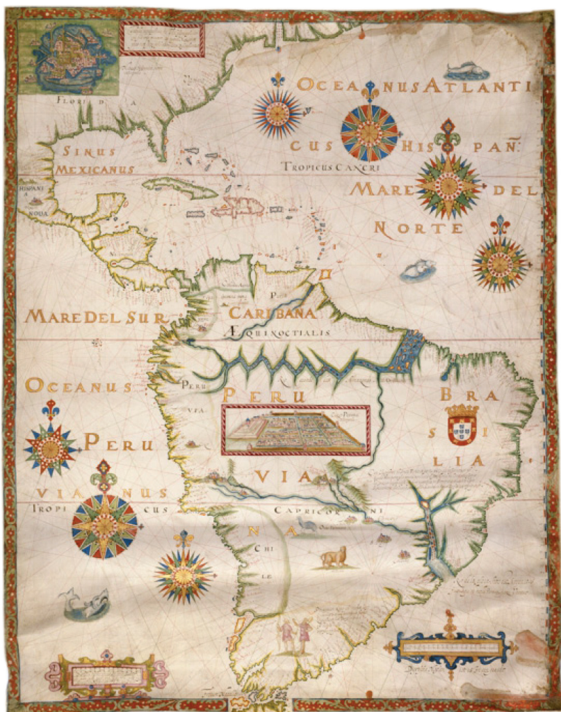
Mapa 2. Evert Gijsbertz, “Mapa de América”, accesado en < http://www.kb.nl/en/themes/maps/more-atlases/spieghel-der-zeevaerdt >. Imagen cortesía de Koninklijke Bibliotheek/The Memory of the Netherlands.

Tercero, la zona del Caribe ya era ampliamente recorrida por marineros, navegantes y comerciantes holandeses: los mapas que confeccionaron los editores de la versión de 1931 a 1937 del Iaerlyck Verhael de Laet (1644) plasman al menos doce viajes de circunvalación por la región del Golfo-Caribe que tuvieron lugar entre 1624 y 1637. Cornelis Goslinga (1971:28-30, 54-56, 58, 60), de hecho, ha planteado que la presencia holandesa en el Caribe fue una regular a partir de la última década del