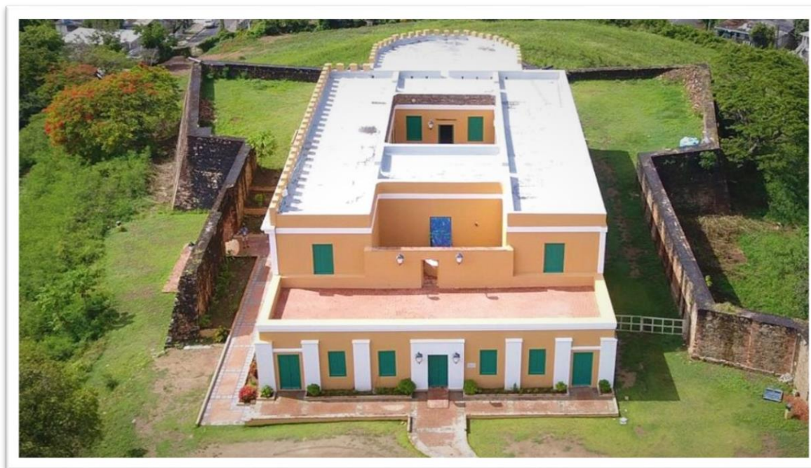
Vista aérea Fuerte Conde de Mirasol *(c. 1845) sede del Museo Fuerte Conde de Mirasol, Programa de Museos y Parques del Instituto de Cultura Puertorriqueña (ICP) y del Archivo Histórico de Vieques (AHV)

Desde 1991, el AHV está localizado en el Fuerte Conde de Mirasol en Vieques con el respaldo del Instituto de Cultura Puertorriqueña. Además, gracias al Proyecto Diásporas Caribeñas de la Universidad de Puerto Rico, Recinto de Río Piedras, y su directora, la Dra. Nadjah Ríos Villarini, cuenta con un espacio virtual en la Biblioteca Digital del Caribe vía acuerdo de colaboración ( https://dloc.com/vieques ). Es por ello que el Archivo se conceptualiza como un espacio virtual y físico para promover la historia y luchas del pueblo viequense desde un enfoque comunitario y participativo. Es además un lugar de encuentro entre diversas comunidades para recordar e investigar el pasado y vislumbrar el futuro de la isla municipio.