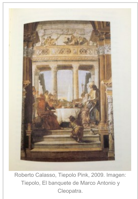
Roberto Calasso, Tiepolo Pink , 2009. Imagen: Tiepolo, El banquete de Marco Antonio y Cleopatra .

En la tercera parte del libro —“Glory and Solitude”— Calasso insinúa la relación difícil y enervada entre Oriente y Occidente con la pareja de Antonio y Cleopatra. Más de diez veces Tiepolo trabajó el tema: encuentros de la pareja, banquetes, conversaciones: Cleopatra ansiosa pero en control, deseosa pero imperial, y Marco Antonio infantil, desatinado, confuso, ignorante. Toda la fortaleza en la mujer y la fuerza bruta en el hombre. Según Calasso, lo que Tiepolo quería era “poner en escena el choque de emblemas, un conflicto entre dos poderes opuestos, destinados a atraerse entre sí, pero solo para destruirse uno al otro.” Se trata de un beso en la mano, de un “refinamiento diacrónico tan encantador como artificial” en “un mundo anacrónico totalmente teatral que no tolera ser comparado con el mundo real”, según Giorgio Manganelli. En otra pintura, los dos dignatarios —Cleopatra, Marco Antonio— reaparecen con sus ropas de estado, él listo para conquistar el mundo, y ella, nos dice Calasso, como regina meretrix, es decir, como reina prostituta. La mirada de Cleopatra es fría y directa, confiada y casi ausente; la de Marco Antonio es melancólica y pensativa, pero ya debajo de la mesa sus manos se entrelazan. Los sirvientes de Cleopatra son orientales. Ellos son los que siempre saben lo que pasa.