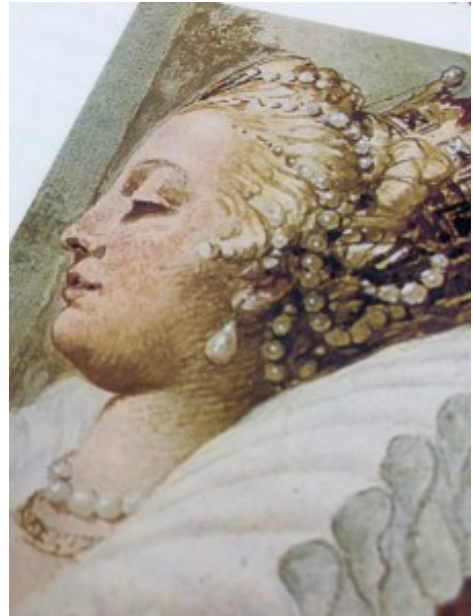
Roberto Calasso, Tiepolo Pink , 2009. Imagen: Gianbattista Tiepolo, Beatriz de Borgoña (detalle), Würzburg.

Il rosa Tiepolo termina con los últimos y tristes días de Tiepolo en Madrid, luego de responder a un encargo del Rey de pintar el Salón del Trono de España. En Madrid fue humillado por artistas mediocres como Mengs, quien privó a Tiepolo de su última gloria. Algunas pinturas pequeñas quedan, que Calasso describe como singulares obras maestras, que estaban destinadas al altar de San Pascual de Baylón, y que fueron removidas de allí para ser reemplazadas por obras de, entre otros, Mengs. Con pesadumbre y drama, Calasso nos dice: “La remoción de las piezas del altar de San Pascual de Baylón marcó el comienzo de la eliminación de Tiepolo in toto de la psique europea.” Sin embargo, aumentaron las visitas a sus cielos en Venecia, en Würzburg, en Milan y en Madrid.” Lo que quedó fue, según Calasso, el rosa Tiepolo.