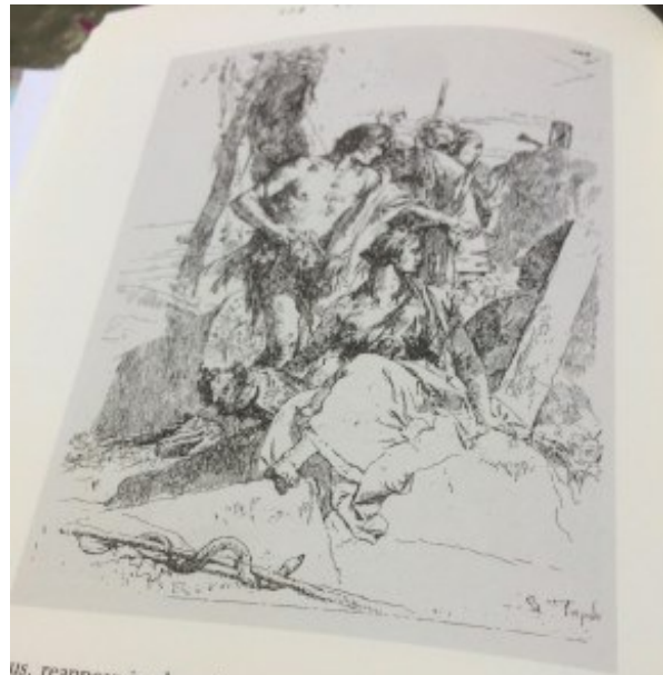
us, reappear in the other Scherzi. It is as if Tiepolo, in the y-three images of the series, had radically reduced the elements that make up the world. As if he had said: the game, our time, is made of these entities, which the viewer is not to see, even though he is still an i of that Roberto Calasso, Tiepolo Pink, 2009. Scherzo núm 18.

La propuesta de Calasso va cobrando forma al descorrer el velo de un mundo atravesado por una antigüedad que permea toda civilización del pasado y del presente. Sus ciencias ocultas son las que nos llevan de la mano a comprender la libérrima permeabilidad de las civilizaciones: unas están tranquilas con su acervo, mientras otra, la europea, vive de ocultarlas y declararlas misteriosas, prohibidas, peligrosas, mortales. Según Calasso interpreta