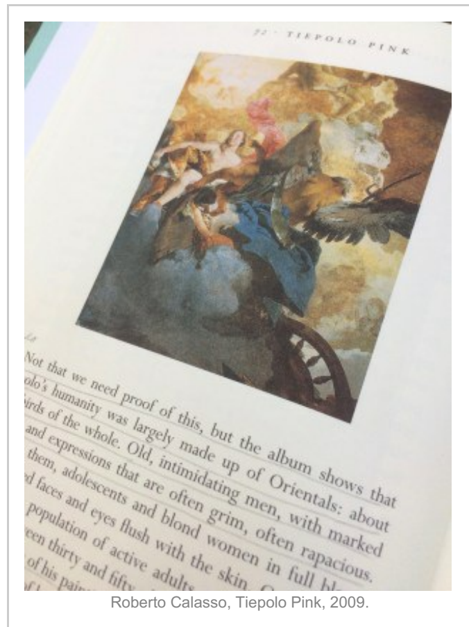
Roberto Calasso, Tiepolo Pink, 2009.

edad, con caras lozanas y redondas. Tiepolo se concentró en escenas casi trilladas para devolverles la vitalidad, como el tema del Venus y el Tiempo, y su insistencia de incluir, como ya mencioné, personajes que de muchas maneras desestabilizaban esa consabida iconografía. Nos dice Calasso: “La premisa de su pintura, tanto sagrada como secular, era una rigurosa selección de tipos humanos, una aniquilación fisionómica que permitía la sobrevivencia de un número restringido de posibilidades. En vez, la variedad de tipos era enorme, entre grupos de toda índole y apariencia. A pesar de esa diversa multitud, la homogeneidad de la pintura de Tiepolo es cuestión de temperamento y de genética, como si Tiepolo hubiera identificado sólo individuos escogidos por los astros, descartando sin miramiento a todos los demás”. A esta extrañeza de los personajes corresponde la audacia de su proceder pictórico. Coleccionista de repertorios de escenas, figuras y ambientes que cuajaban en una fina ars combinatoria , la capacidad de Tiepolo para pintar parecía no tener fin.